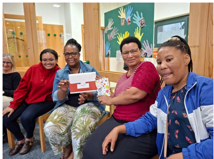
Treffen mit der Frauenhilfe und dem Frauenausschuss.