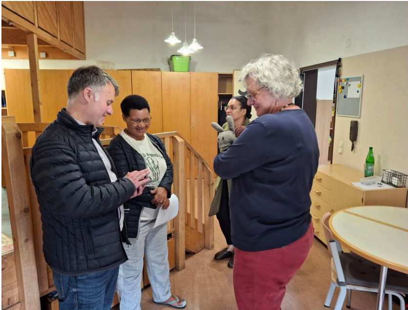
Besuch in der Kita in Kirchberg.

Am 4. September gab es noch ein Treffen mit Mitgliedern der Arbeitsgruppe in Kirchberg, in dem der Besuch reflektiert wurde, bevor am 5. September der Rückflug nach Botswana anstand. Insgesamt wurde der Besuch von beiden Seiten als gelungen betrachtet.