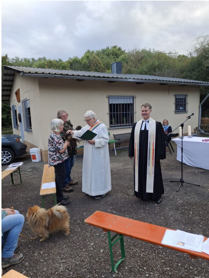
Beim Schöpfungsgottesdienst in Simmern wurden auch Tiere gesegnet.

„Bei aller Traurigkeit, die Gott mit seiner Welt erleben muss mit all dem Leid und mancher bösen Tat, diese Welt sie lässt ihn nicht los. Er seufzt mit ihr, er leidet mit ihr. Ja, am Ende sogar buchstäblich am Kreuz in Gestalt unseres Bruders und Herren Jesus Christus“, macht Markus Risch deutlich. Dies sei für Menschen Zusage und Aufgabe zugleich. Zusage, dass Gott in al-