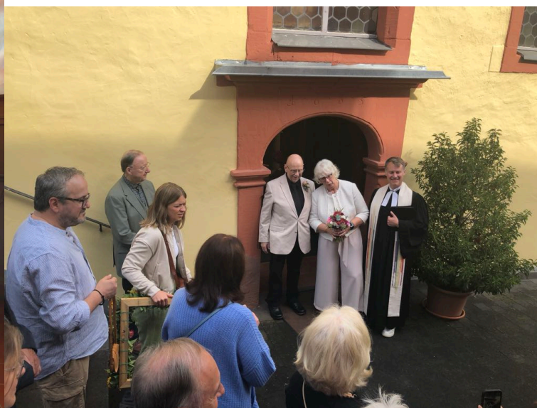
Trauungen und Segnungen gab es auch in der Dorfkirche von Wolf.