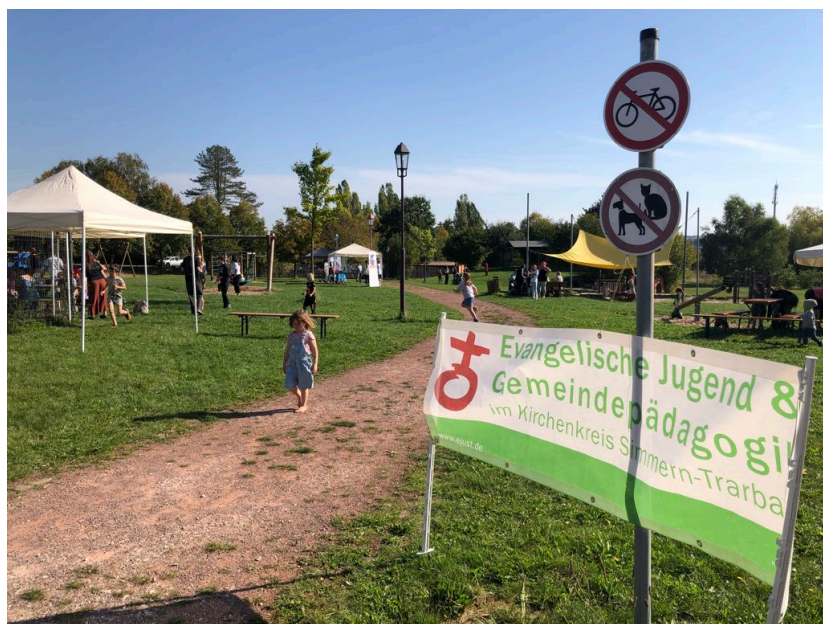
Der Schmiedelpark bei Nannhausen während des Kinderfestes am Weltkindertag

„Kinder haben eine Stimme“, so lautete das Motto des Familientages zum Weltkindertag im Schmiedelpark. Vier Stunden lang gab es ein abwechslungsreiches Programm für die Kinder und Jugendlichen mit Spielsituationen, einer Schnitzeljagd, zahlreichen Angeboten und viel Spaß, dazu leckeres Essen und Getränke an der Bar. „Kinder haben eine Stimme und Kinder haben etwas zu sagen“, unterstrich Markus Risch, der Superintendent des evangelischen Kirchenkreises Simmern-Trarbach bei der Familienandacht zu Beginn des Kinderfestes im Atrium auf dem Schmiedelpark. Dies gelte es zu fördern und wahrzunehmen, betonte der Pfarrer und verwies auf die Kinderrechte, die gerade am Weltkindertag in den Blick genommen werden. Auch in der Bibel würden Kinder und Jugendliche eine ganz wesentliche Rolle spielen, gab der Superintendent zu bedenken und verwies auf die Geschichte