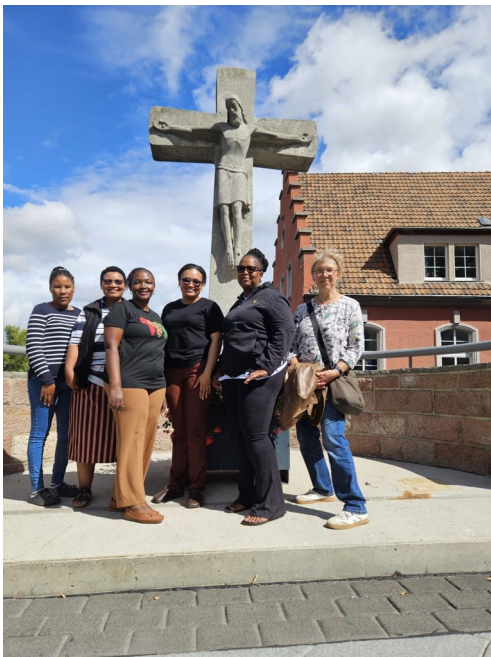
Beim Besuch in Bad Kreuznach.